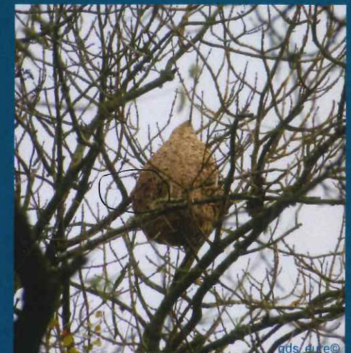
Nid secondaire (40 cm à 1 m) situé principalement en hauteur