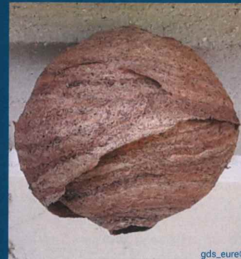
Nid Primaire (taille d'une orange) ruchette, cabane, trou de mur, bord de toiture, roncier..

Entre février et avril, la reine fonde sa colonie, en fabricant un nid primaire dans un endroit abrité (ruchette, cabane, trou de mur, bord de toiture, roncier...) puis la colonie peut se délocaliser vers un nid secondaire construit à un emplacement plus dégagé et plus élevé lorsque le site primaire devient trop étroit.