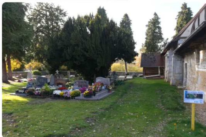
Cimetière de Catelon avant et après